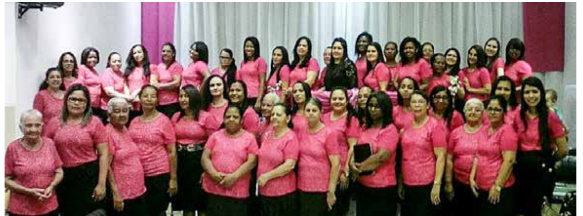
Acontecimento se consolidou como que num verdadeiro "exército" formado por intercessoras que buscam ao Senhor

O tema que referendou o acontecimento foi "Que é que queres, rainha Ester, ou qual é a tua petição?" (Et 5:3).