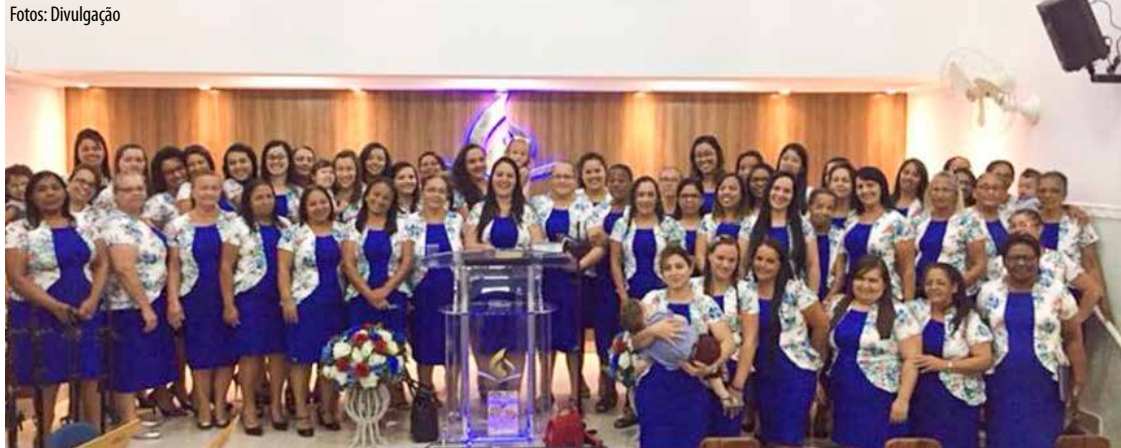
Setor Caiúba se maravilhou pelos 32 anos de conquistas espirituais concedidas pelo Senhor ao conjunto “Cânticos de Vitória”