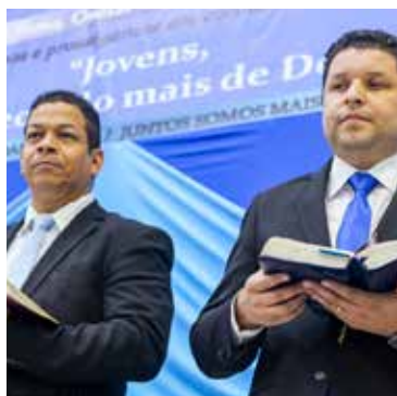
Líderes se emocionaram com os resultados