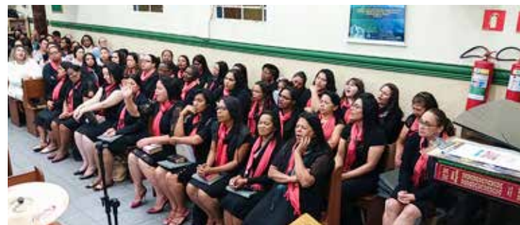
O círculo de oração na sede do Imirim: sustentáculo da obra a partir de fé inabalável nas promessas

Nos dias, inúmeros testemunhos relataram as providências divinas manifestas a partir dos clamores realizados pelas irmãs, quer no particular ou mesmo em campanhas, colecionaram vitórias sobre vitórias no período existencial. A coordenadora do departamento do círculo de oração é