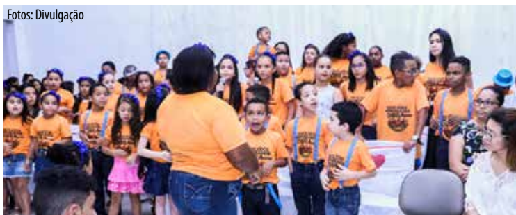
Conjunto infantil deu mostras que os ensinamentos à luz da palavra estão em alta