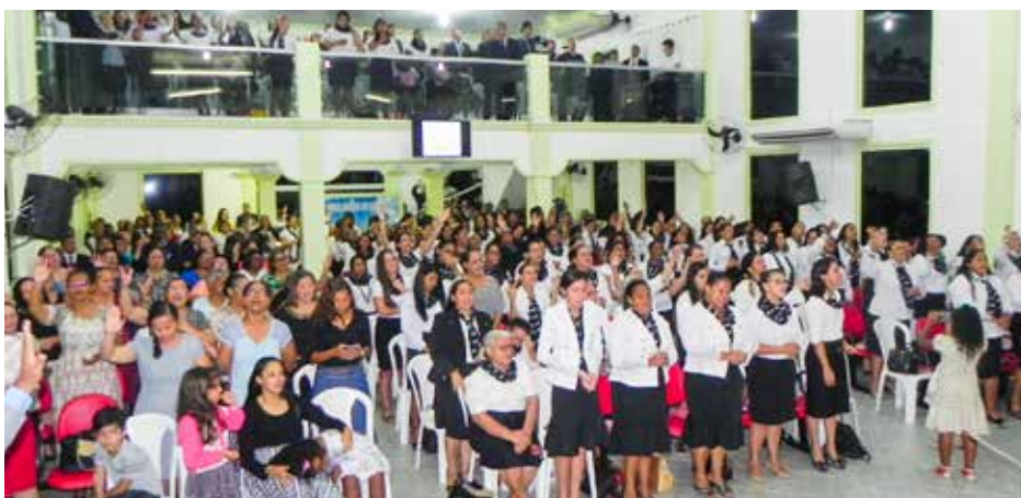
Ministério feminino reforçou a tese de atravessar um momento maravilhoso em nível nacional, promovendo grandes conclave: união e pentecostes