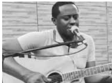
Adorações fizeram grande diferença