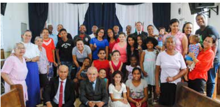
Alunos que compareceram à EBD na conclusão dos trabalhos foram registrados