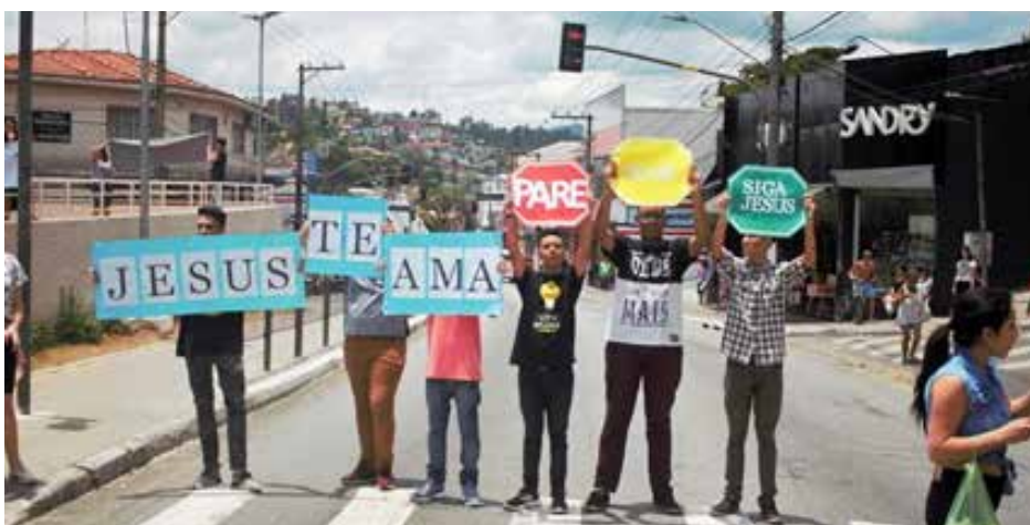
Juventude tomou as ruas portando cartazes e anunciando Cristo como a única esperança

Oportuno, o tema central da festividade foi “Sobre tudo o que se deve guardar, guarda o teu coração, porque dele procedem as fontes da vida” (Pv. 4:23).