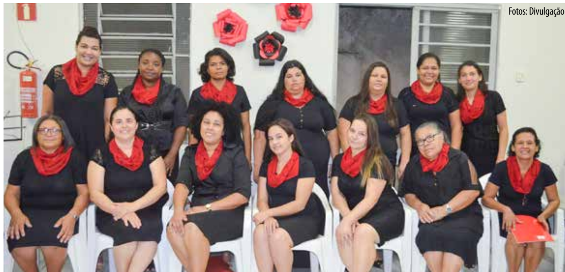
Aos poucos a igreja prudentina vai se organizando e o Senhor fazendo crescer o seu rebanho sob grande organização: integração

O evento perdurou de 6 a 8 de outubro, quando louvores ecoaram em meio à congregação dos justos, o Senhor correspondeu às expectativas, manifestando a sua poderosa glória, preenchendo as expectativas dos que se colocaram na pre-