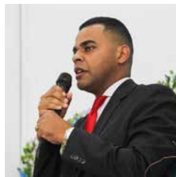
Pr. Wellington Dias foi mensageiro da paz