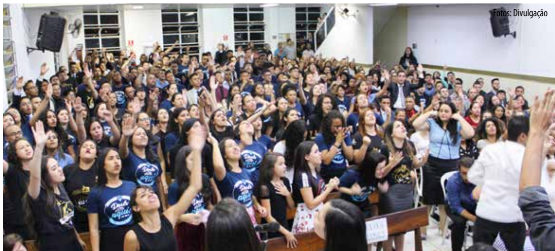
Mocidade foi alcançada por um revestimento espiritual tremendo durante UMADEMP no jardim Damasceno: transformação

SÃO PAULO/SP – Sob o tema “Conheçamos e prossigamos em conhecer ao Senhor” (Os 6:3) e divisa “Jovens conhecendo mais de Deus”, a mocidade que forma o pré-congresso da UMADEMP na regional jardim Damasceno, se organizou de maneira festiva e rendeu cultos ao Todo Poderoso, cravando mais um ano de evento preparatório ao grande congresso de classe, previsto para o início do