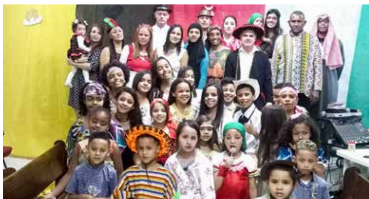
Conjunto “Crescendo com Jesus”: 16 anos de bênçãos às vidas no jardim Ipanema II