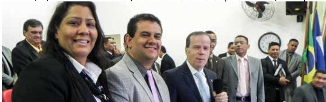
Casal de obreiros ao lado do pastor presidente nacional: reconhecimento pelos feitos na missão de apascentar o rebanho e fazer o melhor por ele