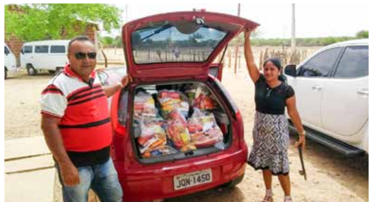
Voluntários lotaram carros e circularam por vilarejos, distribuindo comida aos carentes