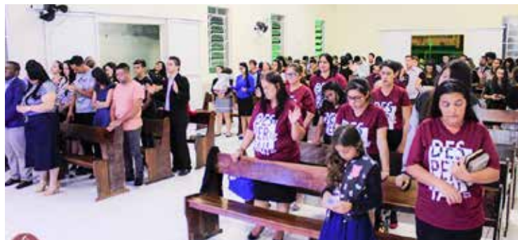
Poder divino se fez manifestar em meio ao povo durante a celebração conjunta

O clima foi maravilhoso, sobretudo por arregimentar à igreja inúmeras famílias descrentes, as quais se maravilharam com aquilo que puderam contemplar.