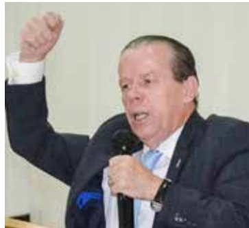
Pr. presidente assinalou presença nos eventos

A igreja foi tremendamente visitada pelo poder celestial durante as celebrações festivas que ocorreram nos dias da EBFO, Convenção e CAMP