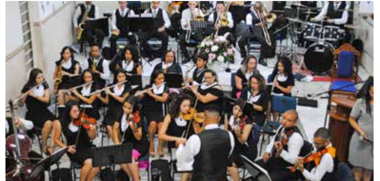
Jazz sinfônica local chegou aos 14 anos sob adorações ao Senhor Jesus Cristo

a diferença” e “durante os momentos de provas, cante. A vitória vem pelo louvor”, ensinou.