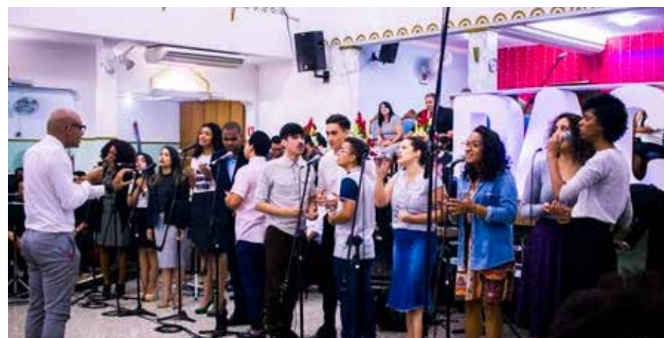
Nos louvores, as mãos divinas se manifestaram, usando cada componente como adorador