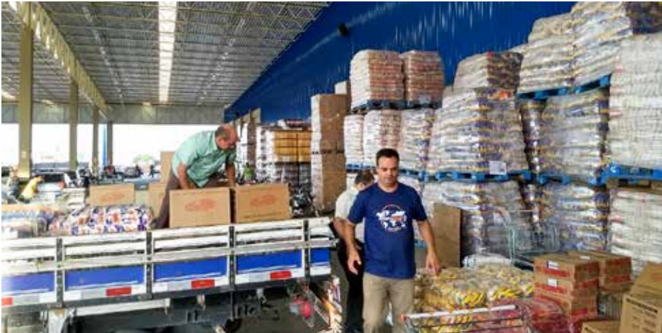
Inicialmente alimentos foram adquiridos junto a um grande atacadista para posterior doação