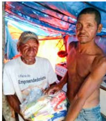
Família recebe cesta doada pela igreja