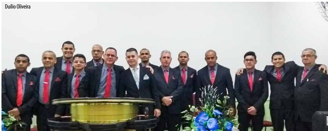
Varões do conjunto “Soldados de Cristo” durante registro fotográfico ao término da festividade que assinalou ano vitorioso

pelo Senhor, demonstraram ótima performance perante o desafio de bem fazer para o engrandecimento da obra.