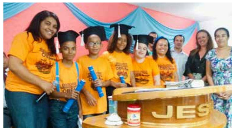
Quem ultrapassou a idade recebeu certificado por participação

dim de Deus”, que vencendo o prazo imposto pela faixa etária, migram para o departamento dos adolescentes. Cada um foi contemplado com o certificado de desempenho enquanto membro do referido conjunto.