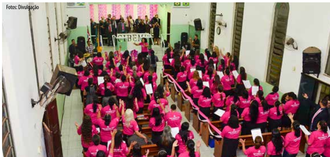
Ministério feminino reforçou a tese de atravessar um momento maravilhoso em nível nacional, promovendo grande conclave: união e pentecostes

adoradores convidados na qualidade especial.