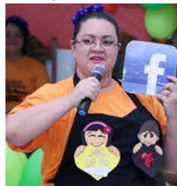
Ministrações foram muito bem recebidas