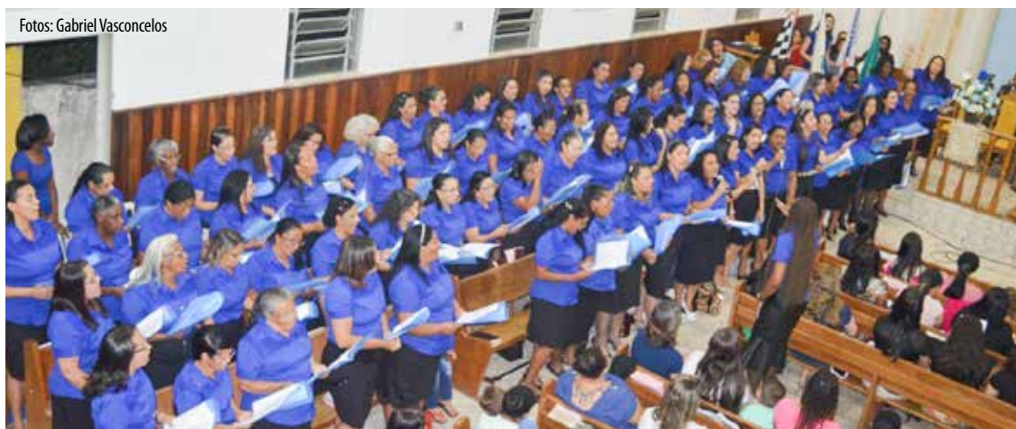
O grupo de intercessão “Celeste”, que tem desenvolvido importantes tarefas perante à obra na sede setorial em parque 120: vitórias celebradas