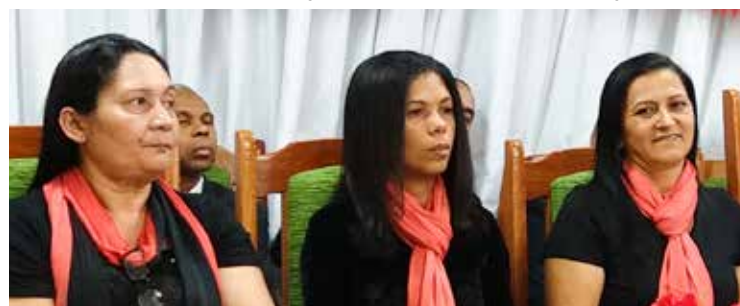
Liderança se alegrou em meio ao poder que foi derramado nos cultos que celebraram as festividades

Foram instrumentos de bênçãos perante a vida das pessoas presentes ao conclave.