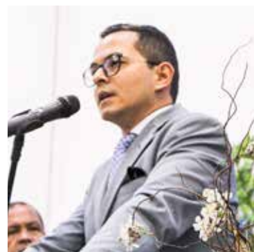
Pr. Otoniel foi usado pelo Pai ao ministrar