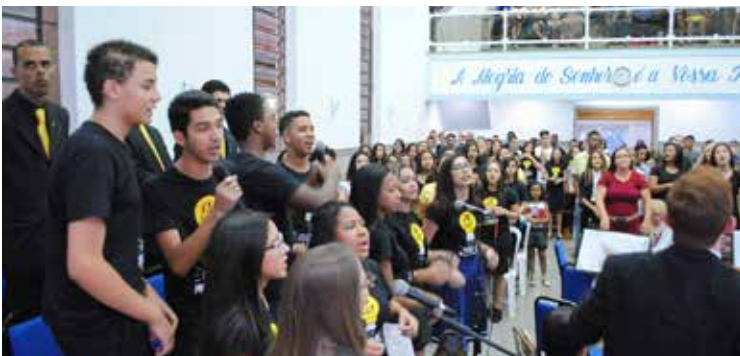
Adolescentes voltaram a promover grande festividade na sede regional: louvor e palavra