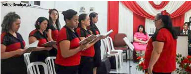
O conjunto louvou a Deus por mais um ano de vitórias perante a igreja

VÁRZEA PTA./SP – Sob o tema “E o espírito diz vem e esposa diz vem! E quem ouve, diga: vem!”, a congregação da AD Perus no bairro varzino jardim Bertioiga, promoveu festividade de destaque ao longo dos dias 15, 16 e 17 de dezembro, oportunidade em que se celebrou o