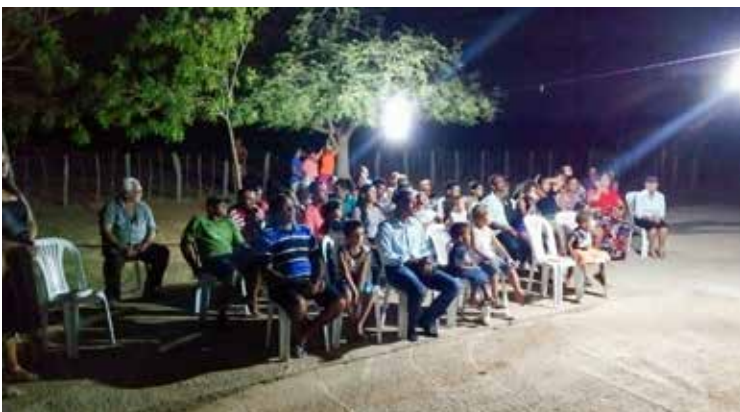
Sob dificuldades, grupo de pessoas participam de culto em pleno sertão: fé no impossível

Em meio aos desafios latentes aos olhos dos obreiros, ótimas notícias foram compartilhadas com a liderança eclesial local: a sede da associação Azarias em Lapão/BA terá continuidade quanto à sua construção, inclusive no local serão ministrados cursos de panificação, horta comunitária, aula de violão dentre outras atividades.