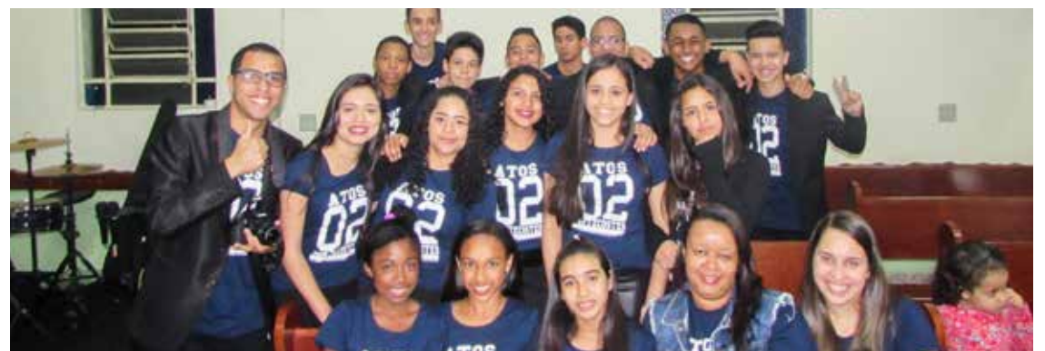
Adolescentes “Adoradores de Cristo”, que completaram 14 anos de marcha na sede no Elisa Maria: celebrações

SÃO PAULO/SP – Sob o tema “E todos foram cheios do Espírito Santo, e começaram a falar noutras línguas, conforme o Espírito Santo lhes concedia que falassem” (At 2:44), o departamento de adolescentes da sede setorial em jardim Elisa Maria comemorou mais um ano de marcha na presença divina. Isso se tornou realidade nos dias 29 e 30 de setembro e 1 de outubro, quando cultos temáticos foram oferecidos ao Senhor em decorrência das vitórias.