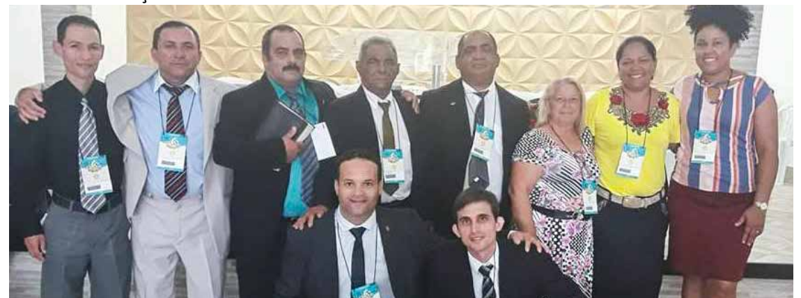
No destaque, obreiros pertencentes ao setor em Presidente Prudente, se regozijando após terem sido separados/consagrados ao ministério