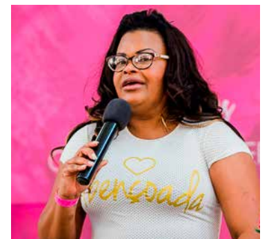
Preletora foi usada com poder e ousadia