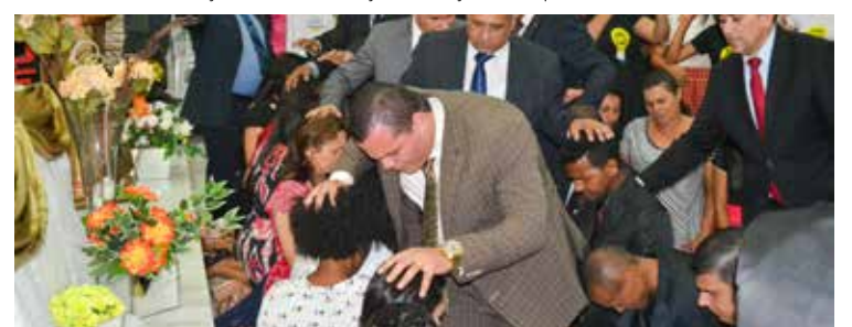
Ao término, vários obreiros ingressaram no rol dos trabalhadores perante à seara santa: chamado divino