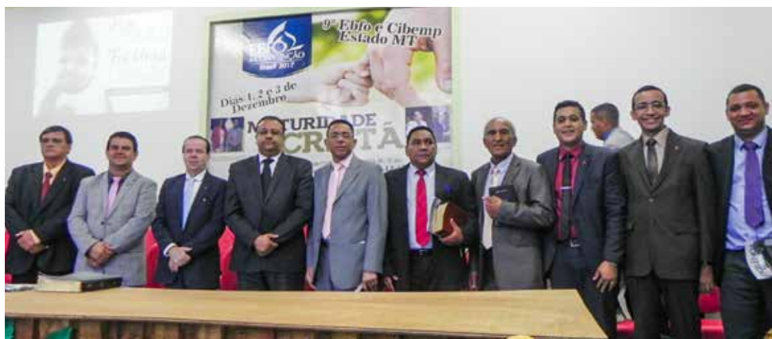
Deus tem operado em meio à liderança, especialmente por conta da diretoria estadual que tem trabalhado com afinco, à busca de ampliar a igreja

Unificados, os acontecimentos retrataram a grandeza ministerial, sua organiza-