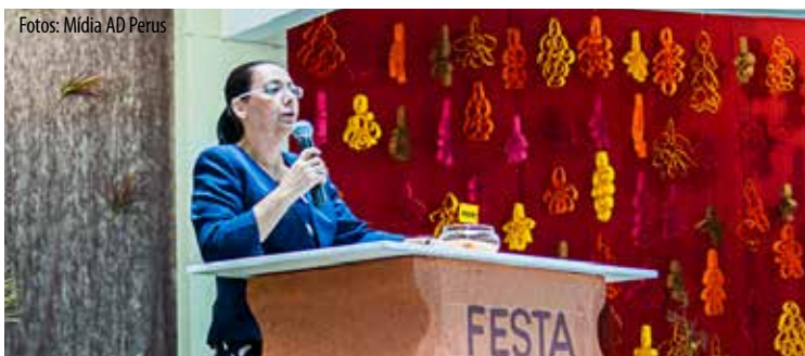
Miss a Ligia dirigiu palavras de gratidão às irmãs que demonstraram ótima desenvoltura

DA REDAÇÃO – Em 9 de dezembro, mediante uma festa maravilhosa e comunhão espiritual afluída, foi encerrado o projeto “Celebração da Colheita”. O tema que sustentou as atividades, iniciadas no mês de maio, foi “Águas que produzem vida”. O embasamento bíblico para as ações se refugiou em Levíticos 23: 33 – 44, quando Deus instituiu a festa do tabernáculo ou mesmo festa da colheita.