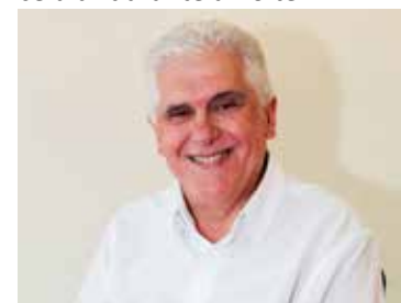
*é médico cardiologista e membro da AD Perus em Jundiaí/SP

Antes de dar um celular ao seu filho, pergunte-se: "uma criança realmente precisa ter um celular?" Os pais também devem considerar reduzir o tempo que as crianças e adolescentes ficam expostos ao aparelho celular. E devem recomendar que seus filhos desliguem o celular durante a noite.