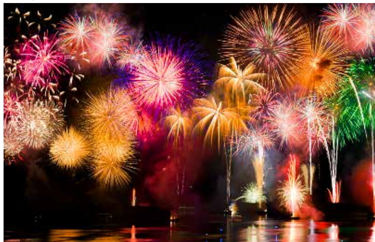
A simples virada do calendário sem atitudes não patrocinará mudanças

“No novo ano tudo vai ser diferente! Vou deixar meus maus hábitos!” Você também tomou resoluções desse tipo, usando a mudança de ano como data para uma virada em sua vida?