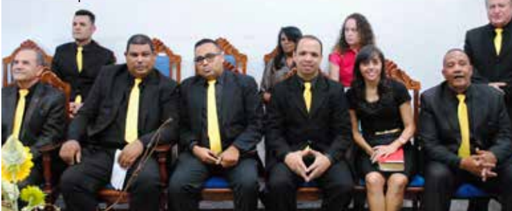
Membros da diretoria realizaram excelente trabalho, promovendo conclave de destaque

SÃO PAULO/SP – Realizado nos dias 8 e 9 de dezembro, o pré-Congresso de Adolescentes do Ministério de Perus (CAMP) da regional vila Souza, foi benção aos que dele tomaram parte. O tema oficial do conclave infanto-juvenil foi “Sal e luz” – o mesmo que embalou o congresso nacional da categoria, na Catedral.