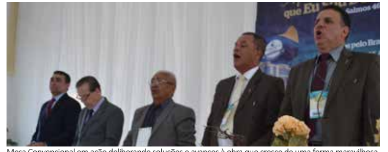
Mesa Convencional em ação deliberando soluções e avanços à obra que cresce de uma forma maravilhosa