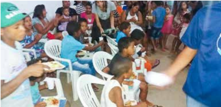
Todos que se dirigiram aos locais de distribuições foram contemplados com alimentação