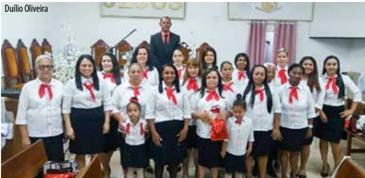
Conjunto "Canção e Paz" em mais um aniversário na presença do Senhor

SÃO PAULO/SP – De 3 a 5 de novembro, a igreja reunida no bairro jardim Vivian e liderada pelo pastor Irineu, fez acontecer cultos festivos pela passagem de mais um aniversário do círculo de oração "Canção e Paz". As mãos divinas se estenderam, alcançando de componentes do vocal aos visitantes.