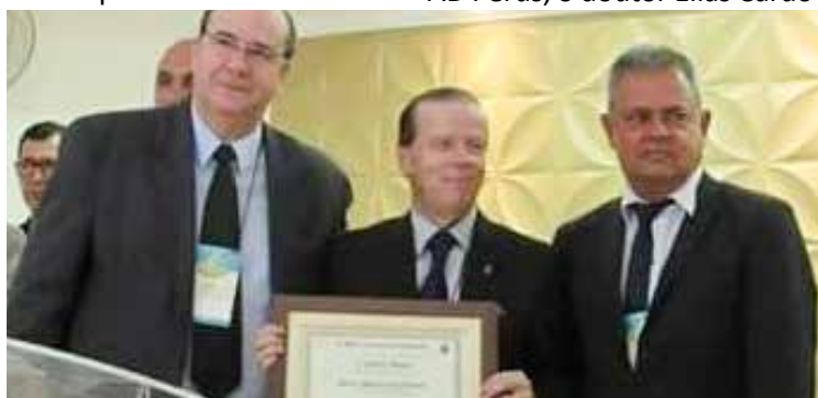
Presidente foi homenageado por político diante do comparecimento seguido à cidade

Na noite de sexta-feira, o pastor presidente nacional da Cooperado mediante as