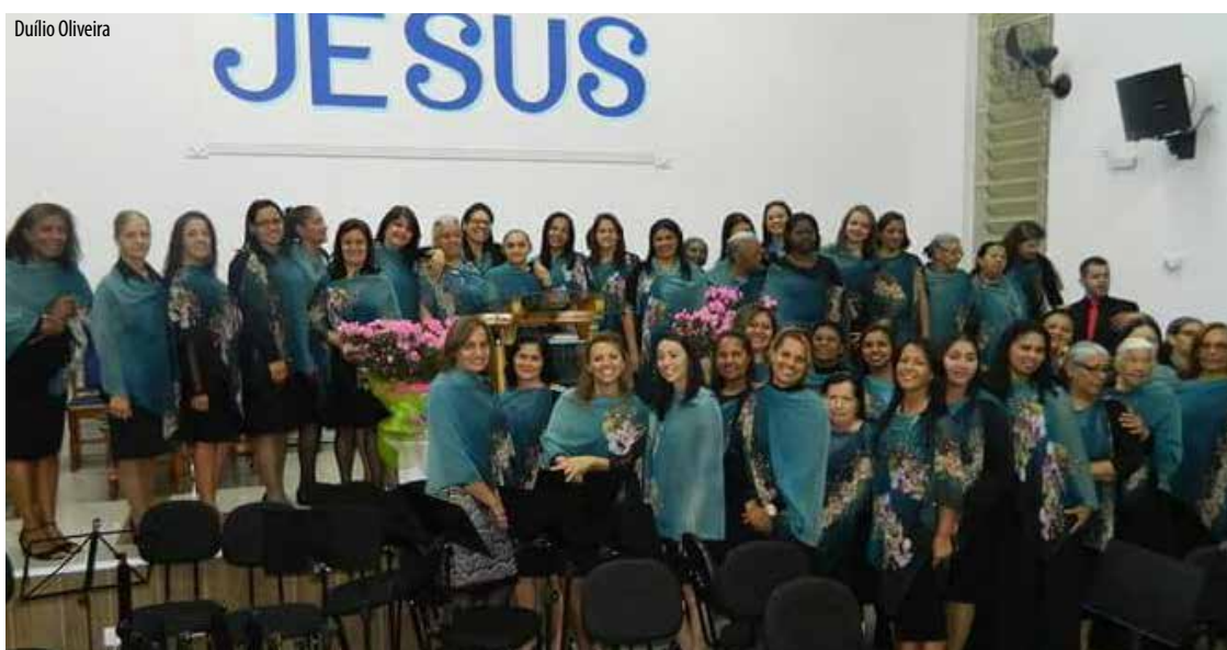
O conjunto “Heroínas da Fé”, da sede regional no Jaraguá, cuja trajetória tem sido assinalada por inúmeras bênçãos recebidas

O Espírito Santo foi um grande aliado do conjunto. A exemplo da companhia inseparável que mantém diante dos clamores que recebe por bênçãos, curas, milagres e so-