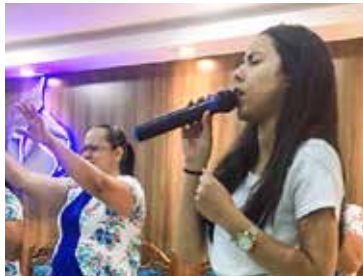
Adorações compuseram a liturgia festiva