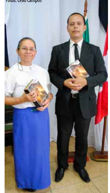
Superintendentes fizeram excelente trabalho