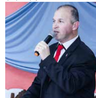
Pr. Francisco apoiou o evento com ousadia