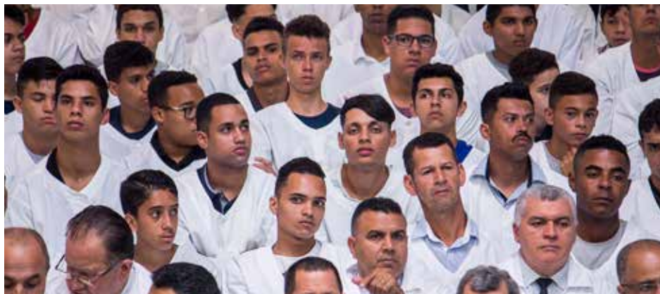
Visão de alguns candidatos pertencentes ao sexo masculino, momentos antes do batismo

Em 2017, sede nacional promoveu quatro batismos, sendo o ato de dezembro o que mais reuniu candidatos; na média, a cada três meses, 327 pessoas adentraram à comunhão