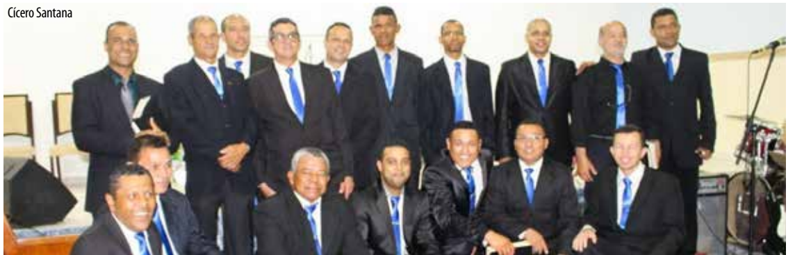
Sede em Ouro Fino Paulista tem sido abençoada por dispor de um conjunto varonil atuante e consagrado ao Senhor

RIBEIRÃO PIRES/SP - O grupo de varões da sede setorial em Ouro Fino Paulista, comemorou seu segundo aniversário. A festividade foi promovida nos dias 17 e 18 de novembro, cujo tema inspirando os presentes apontou para Lucas 15:18: "Levantar-me-ei, e irei ter com meu pai". A liderança da UMADEMP testemunhou a vitória alcançada pelo grupo.