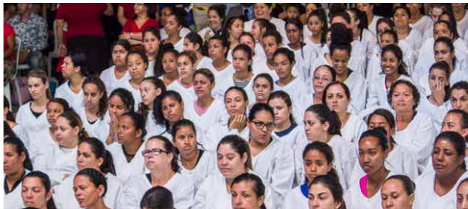
O número de irmãs que desceram às águas ficou acima do registrado em relação aos irmãos