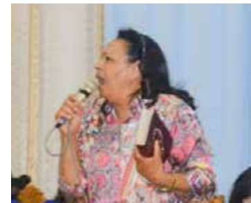
Missª Gedália foi oradora em um dos cultos

Oliveira e o evangelista Fernando Barbosa. Trataram-se de testemunhas autênticas das vontades divinas reveladas mediante a aplicação incontestada da palavra. O fogo espiritual desceu, alcançando vidas e virando cativeiros.