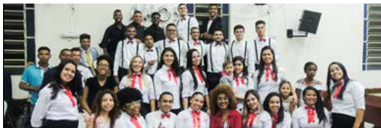
Juventude foi abençoada no jardim Elisa Maria por mais um ano de marcha ininterrupta

De 27 a 29 de outubro, sob poder e glória, jovens celebraram os 24 anos do conjunto, na sede setorial no jardim Elisa Maria. Deus visitou o seu povo.