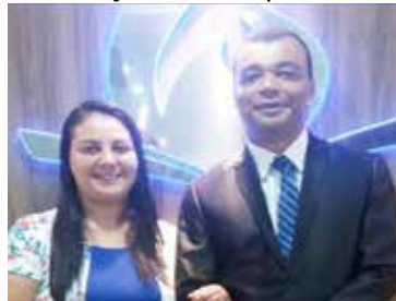
Casal pastoral se alegrou ante os resultados