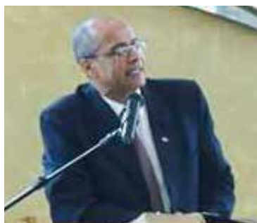
Pr. Joinville foi o orador oficial

De acordo com a organização, a participação alcançou 250 varões, que posteriormente se deliciaram em meio às iguarias disponibilizadas ao café que se serviu.