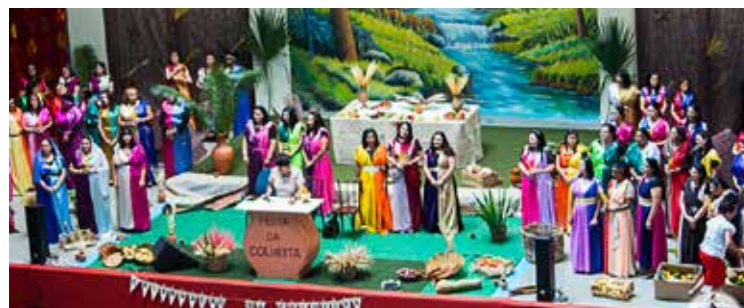
Diversas atividades fizeram parte da programação que concluiu mais um grande projeto

No início do projeto, cada coordenadora recebeu um pequeno cântaro com oferta, simbolizando as águas que dariam vida à colheita futura. Ao longo desses sete meses foram realizados “Cultos dos Talentos” em âmbito regional, quando cada coordenadora se empenhou, mobilizando o conjunto de liderados sob a sua responsabilidade. Deus operou e fez frutificar os donativos.