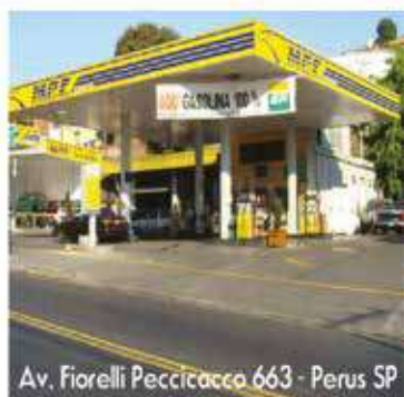
Av. Fiorelli Peccicacco 663 - Perus SP

SUPER TROCA DE ÓLEO FILTROS / LAVAGEM COMPLETA ABASTECIMENTO E ACESSÓRIOS