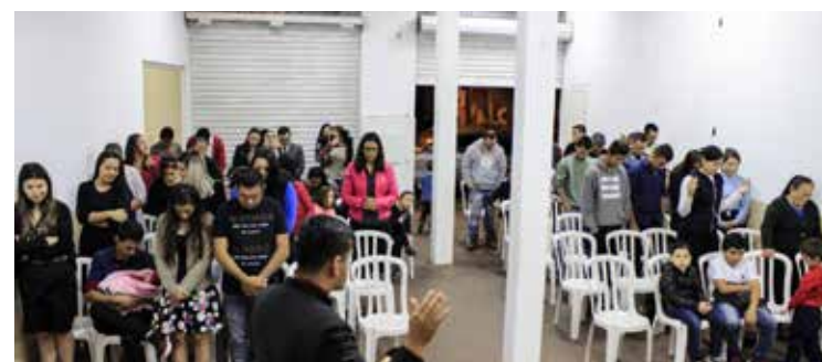
CONGREGAÇÃO já foi iniciada com vários irmãos, projetando que a obra ganhará musculatura maior