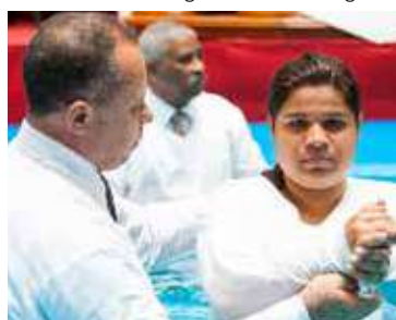
CANDIDATOS se alegraram rumo às águas