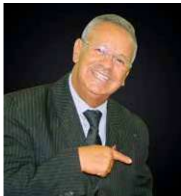
PR. VANIR é o diretor do culto Noite da Benção