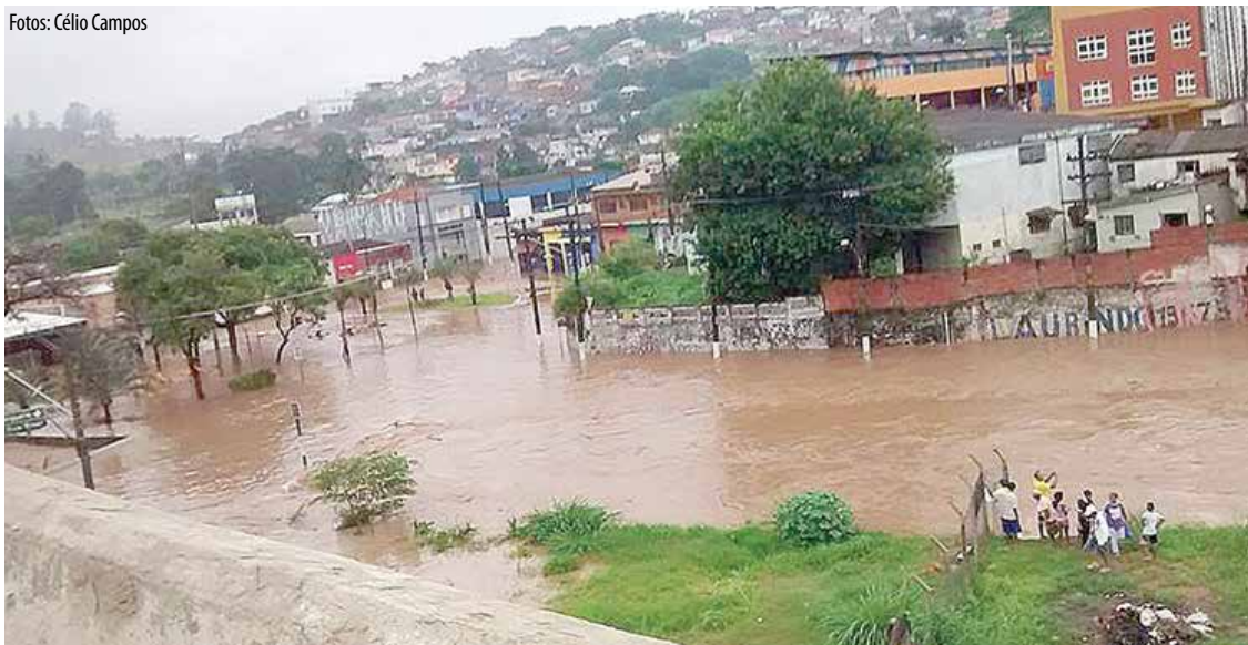
Falta de planejamento e de políticas públicas de resultados práticos vêm penalizando o bairro a cada chuva: parque linear tem sido promessa