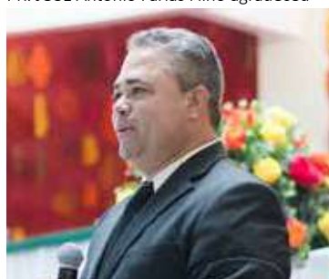
CUBA: muitas almas a serem conquistadas