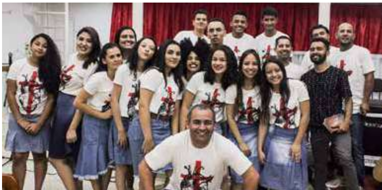
ADOLESCENTES perante o conjunto que celebrou 19 anos de muitas conquistas junto ao Senhor

SÃO PAULO/SP – De 15 a 17 de setembro, o conjunto de adolescentes “Kadosh”, órgão oficial da sede setorial em vila dos Palmares, regional Morro Doce, São Paulo, proporcionou momentos de grande enlevo espiritual, celebrando os 19 anos de existência do departamento. Adorações, testemunhos e pregações da palavra transformadora, fizeram do acontecimento um dos grandes eventos anuais junto ao setor.