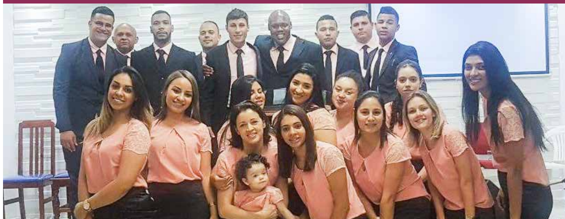
MOCIDADE “Adonai” em mais um evento comemorativo: bênçãos pelo fortalecimento do conjunto

SÃO PAULO/SP – Igreja lotada em todas as noites, pentecostes, comunhão, adorações e muitas pregações, fizeram parte do conteúdo programático que ofereceram os cultos festivos, realizados no jardim Ipanema II, nos dias 15, 16 e 17 de setembro. Na oportunidade, o conjunto de mocidade “Adonai” completou aniversário. Dirige a igreja o pastor Manassés Cavalcante.