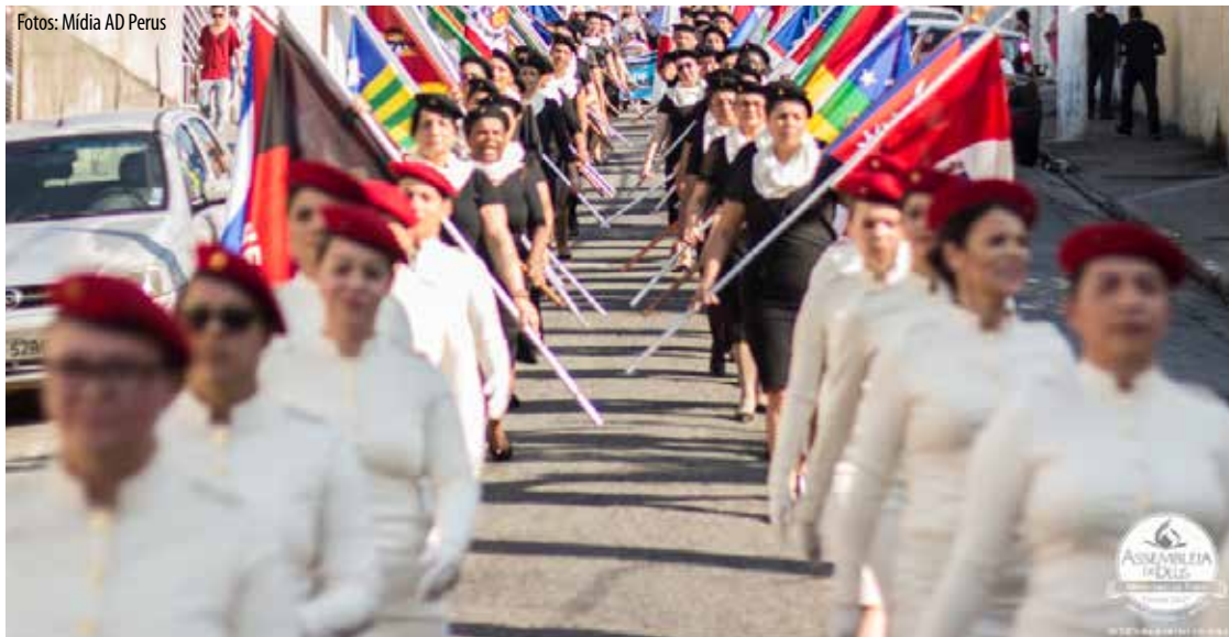
Assembléia de Deus tem sido presença constante no bairro onde se estabelece desde 1947: apoio espiritual e militância social intensa