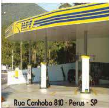
Rua Canhoba 810 - Perus - SP