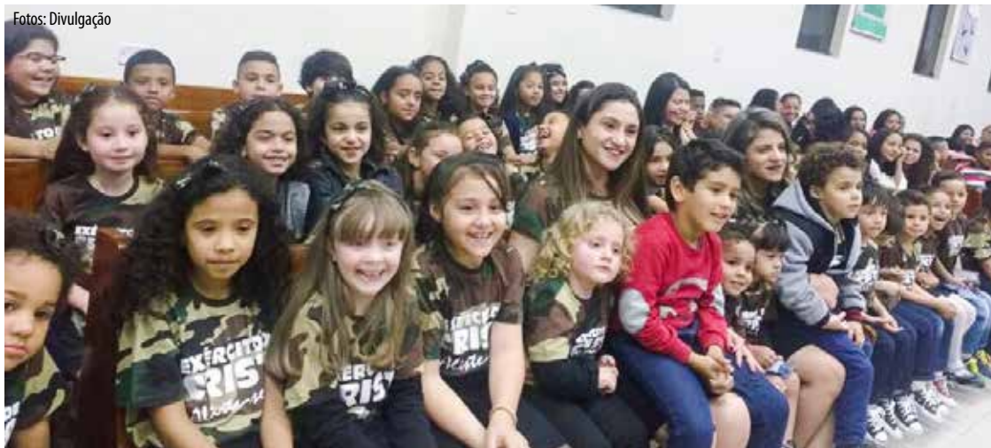
O CONJUNTO “Estrela da Manhã”, que mediante marcha e fé inabalável, chegou aos 14 anos de existência na sede regional em Mauá: agradecimentos

escolhidos, diretamente focados às batalhas espirituais.