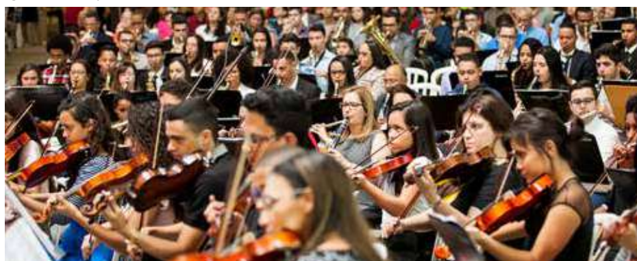
FESTA espiritual tem contado com apoio de músicos durante todos os acontecimentos