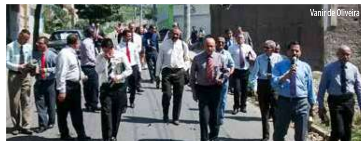
IGREJA saiu às ruas anunciando o arrependimento mediante a fé professada em Cristo Jesus

Deus bradou em meio à congregação dos santos, todos foram cheios, repletos do poder celestial e vidas acabaram sendo transformadas para honra e glória do nome santo do Senhor no decorrer dos três dias. (Com colaboração de Willinson I. Costa)