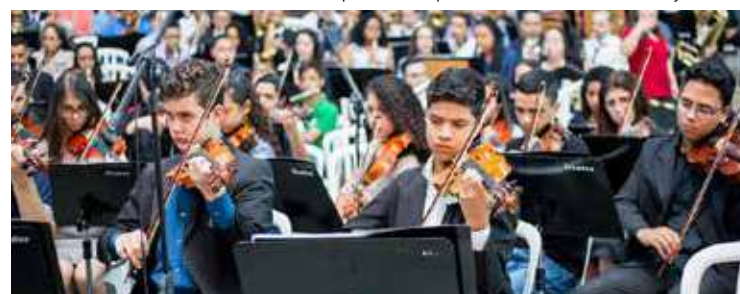
FESTA espiritual tem contado com apoio de músicos durante todos os acontecimentos