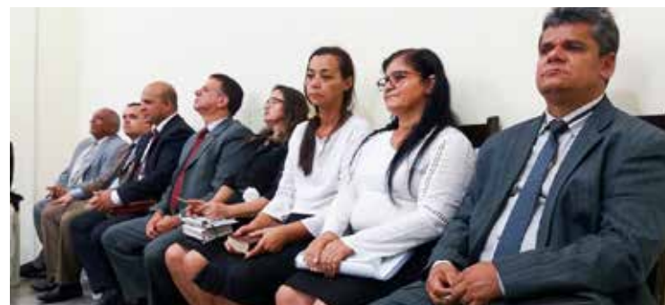
LIDERANÇA e obreiros unidos em prol das grandes operações divinas que só Cristo oferece