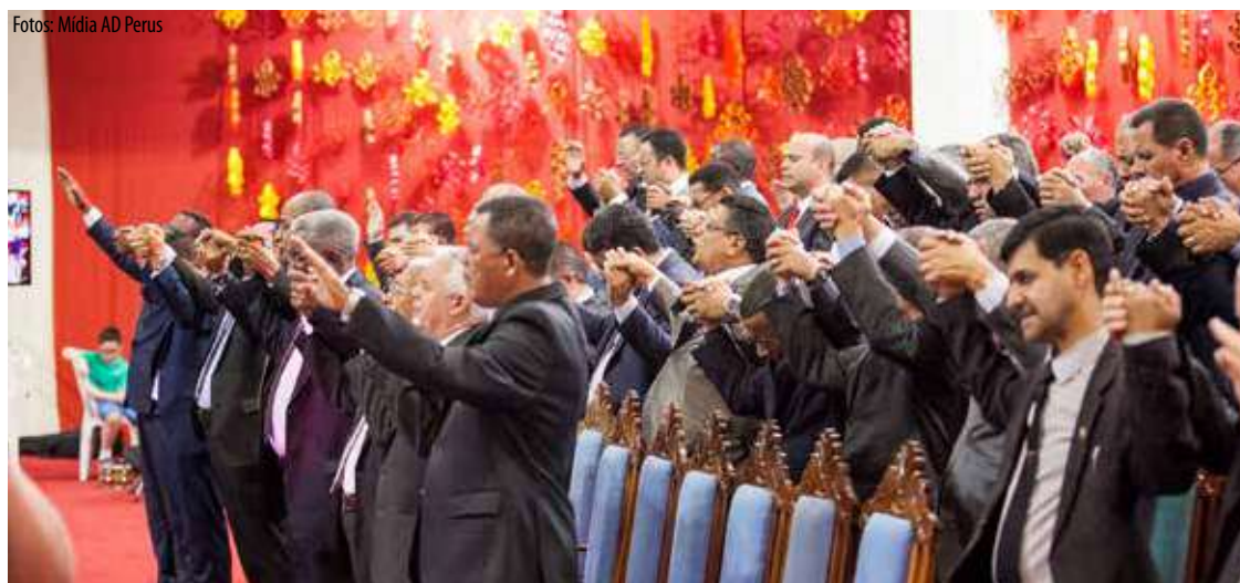
MINISTROS e obreiros levantaram clamores aos céus, intercedendo pela obra missionária nacional e internacional, durante congresso que produziu marcos ministeriais

maneira que possamos ter as nossas mãos confirmadas pelo Senhor. Aliás, será que ele confirmaria as suas obras?”, encerrou, chamando todos à necessária reflexão.