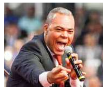
DEUS bradou em meio aos seus: chamado