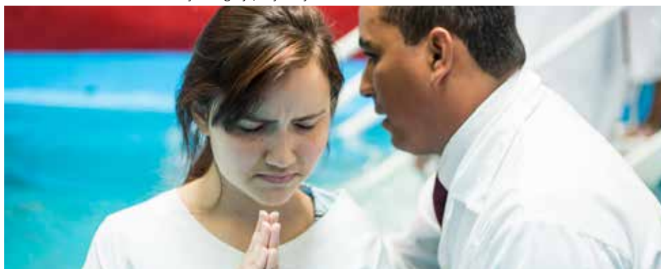
DESCIDA às águas exige uma profunda reflexão e implica responsabilidade com a igreja