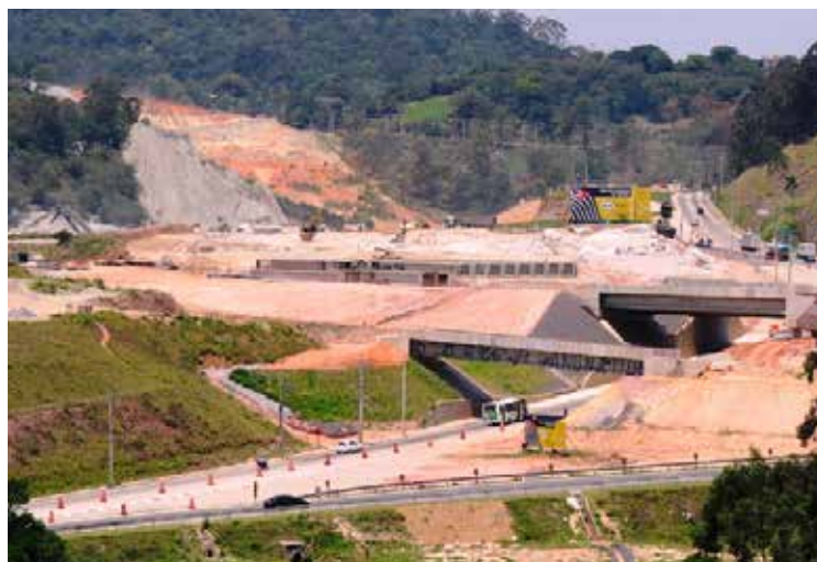
Maior obra viária do país, Rodoanel requer adequação para não se transformar em "calha d'água"