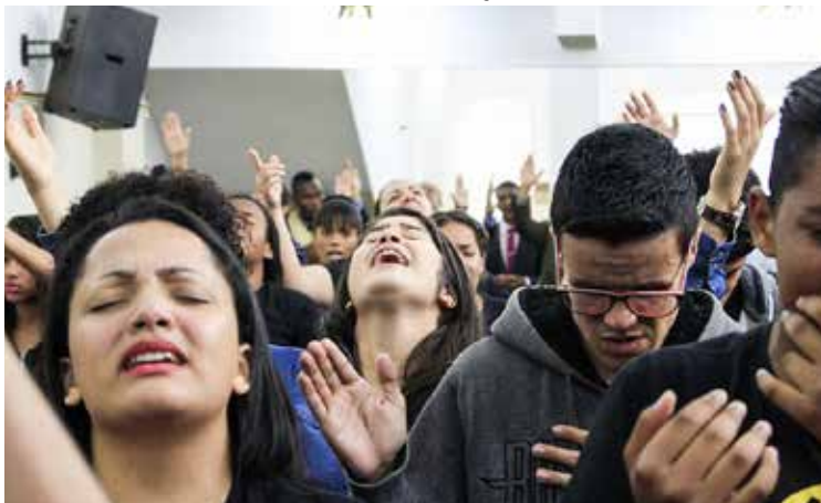
CONSOLO espiritual alcançou vidas, transformando-as pelo poder da palavra ministrada

Representações juvenis de regionais como Jaraquá, Campo Limpo Paulista, Franco da Rocha e Centro cooperaram, adorando e recebendo, ao mesmo tempo, bênçãos celestiais.