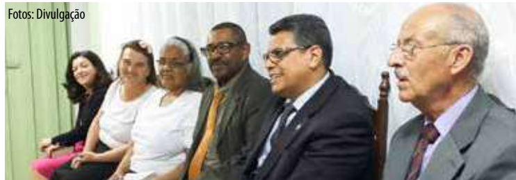
LIDERANÇA se mostrou presente em meio ao acontecimento marcante na igreja