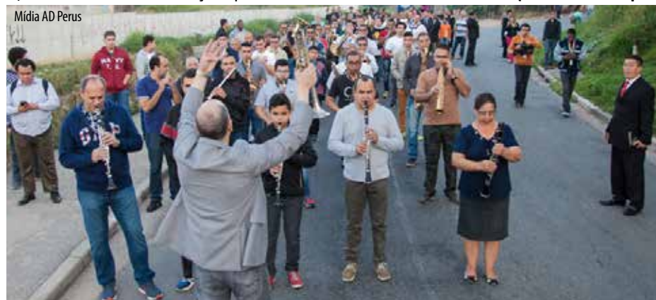
ALVORADA realizada há 70 anos, já congregava muitos músicos em meio à banda unida em deslocamento