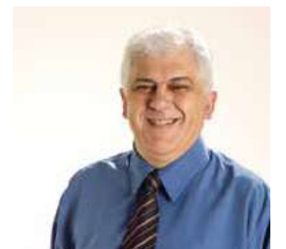
*é médico do trabalho e cardiologista

Um diferencial deve ser feito com a narcolepsia (sonolência súbita) a síndrome de Kleine-Levin (em que se dorme por até 18 horas por dia) e distúrbios do sono REM.