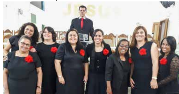
AUXILIARES tem tido papel fundamental na organização do trabalho focado em curas divinas, milagres e libertação