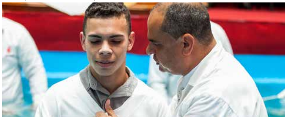
CANDIDATOS se alegraram rumo às águas: novidade de vida e eternidade com Cristo