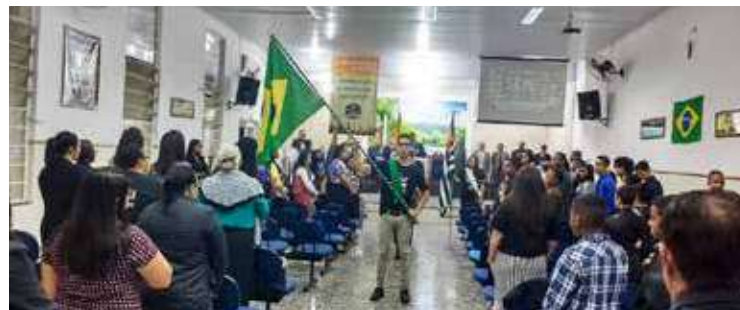
TRABALHO ganhou elevada repercussão e o nome do Senhor Jesus foi glorificado nos dias