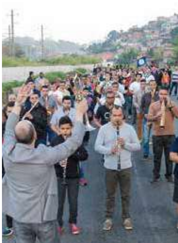
Músicos em ação na “Alvorada” anual