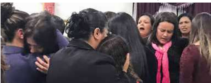
PENTECOSTES foi derramado e vidas transformadas durante os cultos avivados pelo Senhor