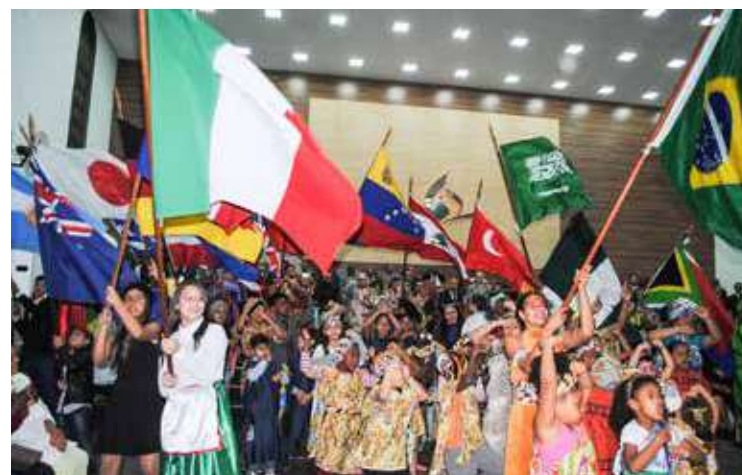
BANDEIRAS anunciaram a visão expandida de reino e desafiou que vidas necessitam de salvação