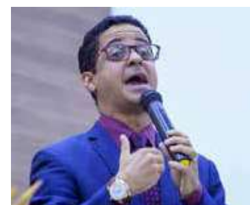
ESDRAS Lima novamente foi usado por Cristo