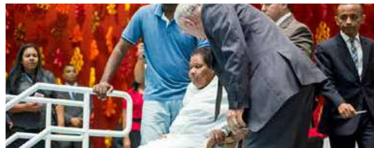
NEM MESMO a mobilidade reduzida impede com que a fé caminhe rumo ao objetivo