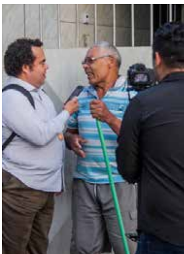
Morador elogiou ações da AD de Perus

DA REDAÇÃO - O 7 de setembro tem um significado especial para a Assembléia de Deus do Ministério de Perus, popularizada como a “Igreja do Relógio”. E isso já perdura por 70 anos, completados justamente em 2017. A igreja começou a ser realidade no bairro em 1947, por conta da chegada a Perus do então presidente fundador, o pastor Benjamim Felipe Rodrigues, falecido em 2002. Desde então, no Dia da Pátria, como é chamada a data, a igreja ocupa as ruas do bairro com duas grandes atividades: a Alvorada, que tem início às 6h e o desfile com todos os departamentos da igreja, bandeiras e músicos, às 14h.