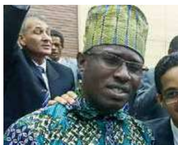
MISSº Nsimba elogiou os cultos promovidos