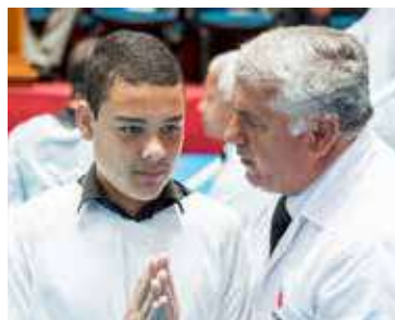
CANDIDATOS se alegraram rumo às águas