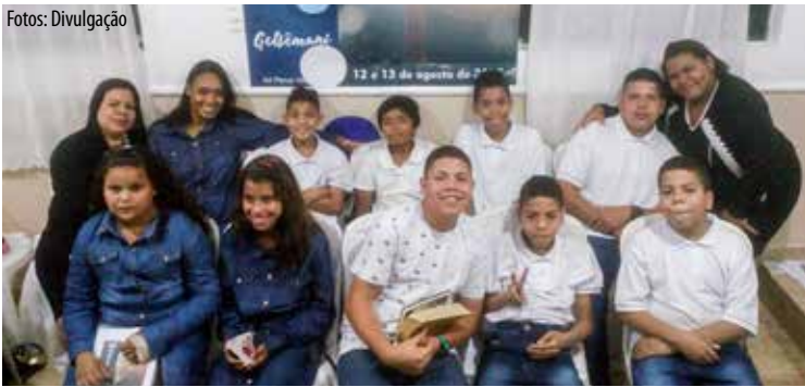
GRUPO "Getsêmani", que encontrou motivos para adorar ao Pai por mais um ano de caminhada