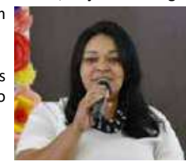
*é missionária e presidente regional do CIBEMP em Campo Grande/MS