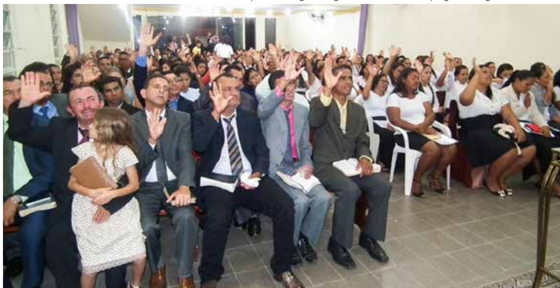
ASSISTÊNCIA, repleta de membros e convidados, não arredou pé do acontecimento e foi igualmente tocada pelo santo consolador