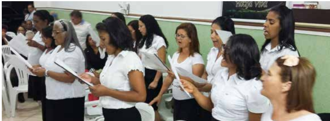
O CONJUNTO "Rocha Viva" adorando durante culto comemorativo ao oitavo aniversário existencial: alegria imensa que vem do alto

CONTAGEM/MG – Nos dias 16 e 17 setembro, componentes do círculo de oração "Rocha Viva" celebraram o oitavo aniversário de vida vitoriosa aos pés de Cristo. Na realidade, a congregação a que pertence o departamento se estabelece no jardim São Luiz, no tradicional município. A sede setorial se localiza na capital, sendo que em nível regional o trabalho pertence a Francisco Morato, na Grande SP. O tema oficial da celebração foi "Eis que venho sem demora; guarda o que tens, para que ninguém tome a tua coroa" (Apoc 3:11).