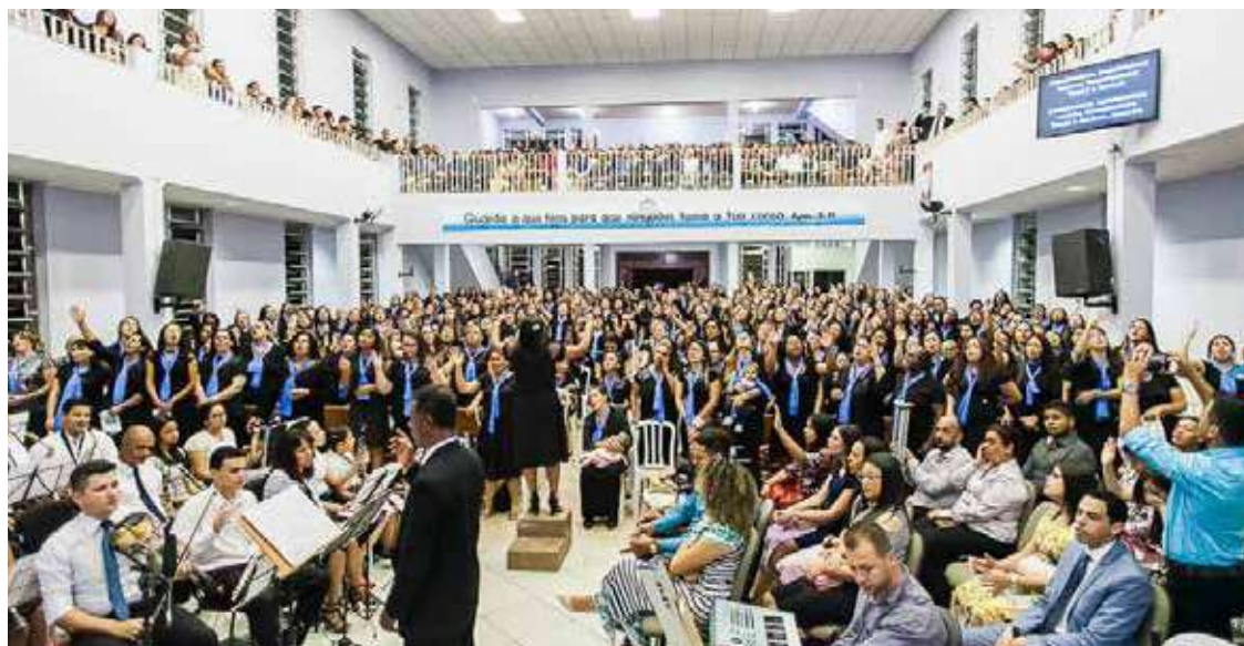
CONGRESSISTAS promoveram um dos maiores conclaves dos últimos tempos: comunhão, adoração e palavra

E disse-lhes: Quem tem ouvidos para ouvir, ouça.” Marcos 4.1-9