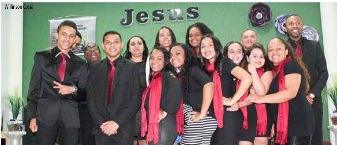
INTEGRANTES do conjunto "Geração de Adoradores" festejaram com alegria e gratidão o aniversário concedido pelo Senhor; boa cooperação e avivamento