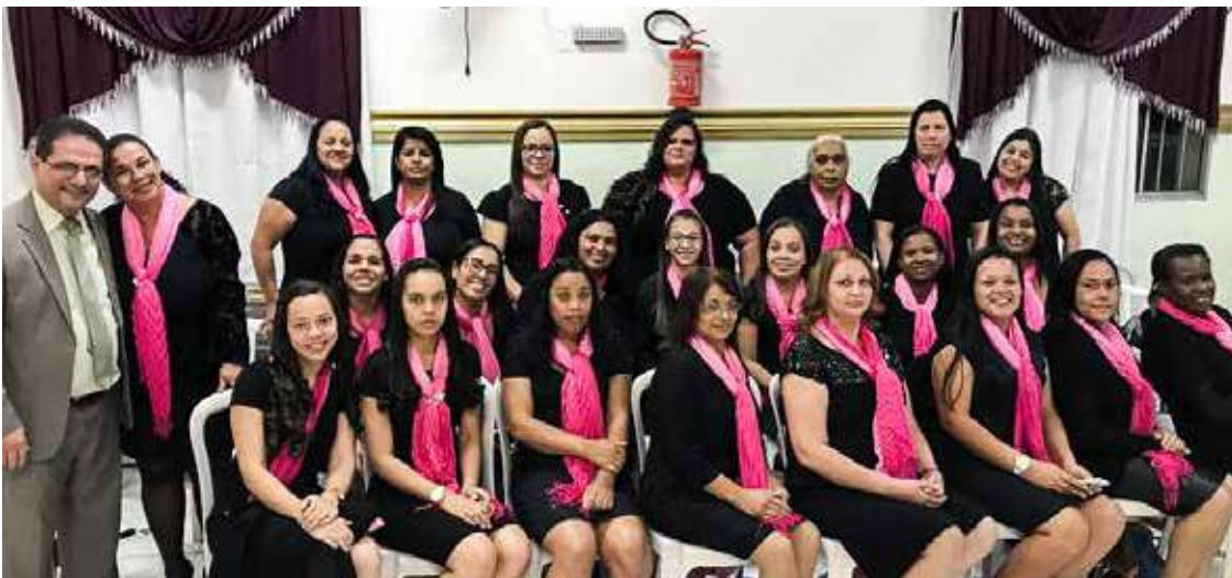
O CONJUNTO “Louvores de Sião”, que pela fé assinalou 15 anos de participação direta na estruturação espiritual da igreja: festividade em gratidão a Cristo

SÃO PAULO/SP – Congregação pertencente à regional em jardim Cachoeira, irmãos que servem ao Pai no jardim Peri experimentaram as manifestações divinas durante festividade que selou o 15º aniversário do conjunto do círculo de oração “Louvores de Sião”. Para tanto foram reservadas as noites dos dias 1, 2 e 3 de setembro. Deus operou grandes coisas perante os seus filhos.