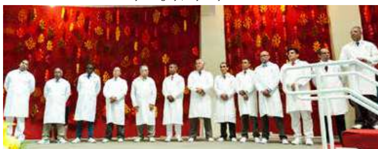
ATO reuniu vários oficiantes que atuam em missões internacionais: prestígio merecido