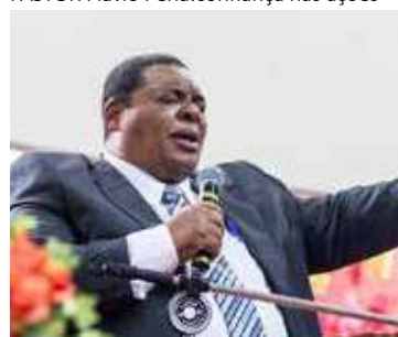
MENSAGEM de sábado impactou milhares