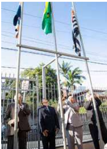
Civismo vem mantendo viva a tradição