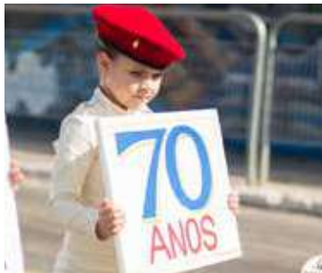
Crianças mantêm as práticas desde cedo