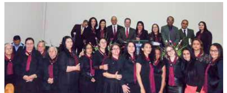
DEUS trabalhou nos dias festivos que envolveu as irmãs: adorações, união e palavra pregada

RAFARD/SP - Nos dias 28,29 e 30 de julho, cultos avivados assinalaram a passagem do quinto aniversário do conjunto do círculo de oração em Rafard. Deus operou poderosamente, de maneira que a sua glória foi manifesta e todos se alegraram.