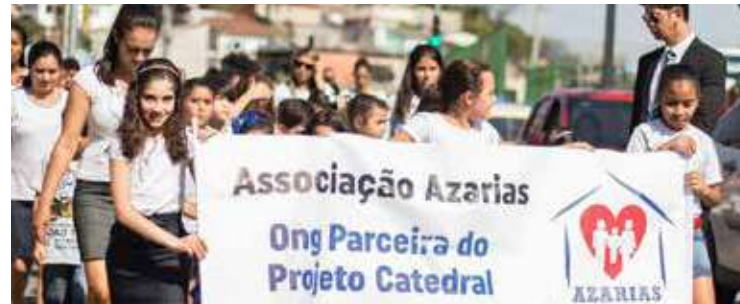
Associação AZARIAS é o braço social da igreja por onde se operam as ações humanitárias

por ruas contíguas à igreja e depois se enveredou por vias menos movimentadas no jardim Adelfiore.